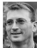
di Enrico Rota